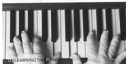
UNLEARNING THE PIANO

BIO Karen Trask (bio), voir/see À rien , page 118.